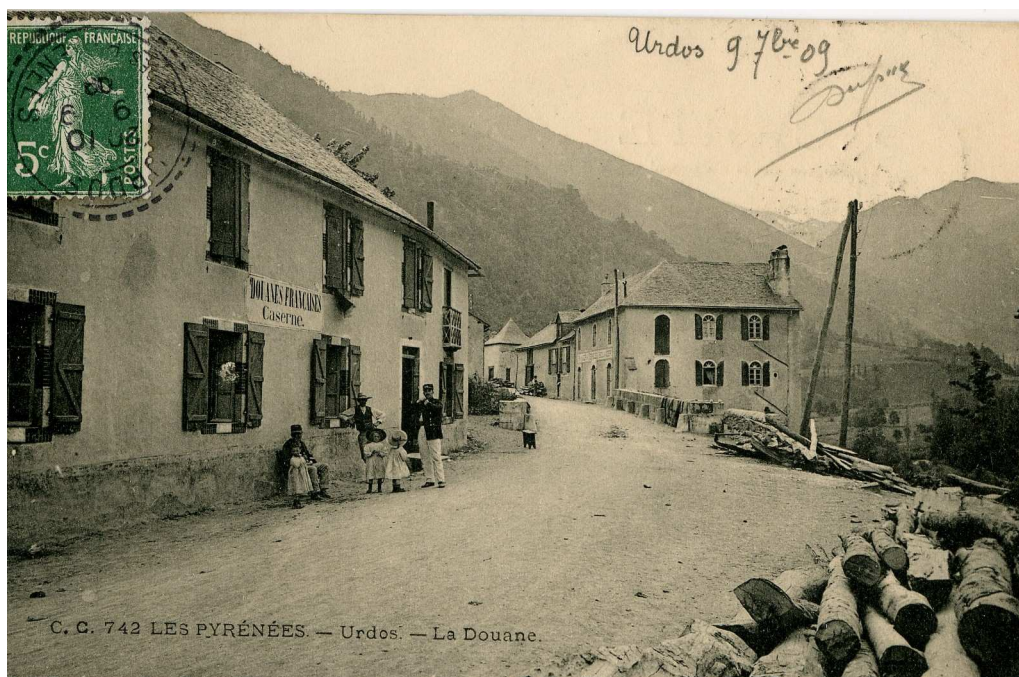
Bureau des Douanes d'Urdos, Carte postale, 1909.