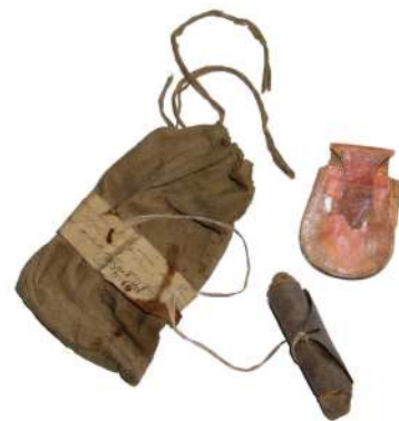
Pièces à conviction issues des fonds des tribunaux criminels de la Révolution, Paris, Archives nationales, Z 3 7.

L'enthousiasme révolutionnaire qui anime les Constituants ne leur enlève cependant ni la conscience des réalités ni le souci de l'ordre public : les juridictions d'Ancien Régime vont cesser leurs activités sans avoir pour autant réglé toutes les procédures en cours, alors que les prisons regorgent de détenus en attente de jugement. Car, à Paris comme ailleurs, le crime ne s'arrête jamais !