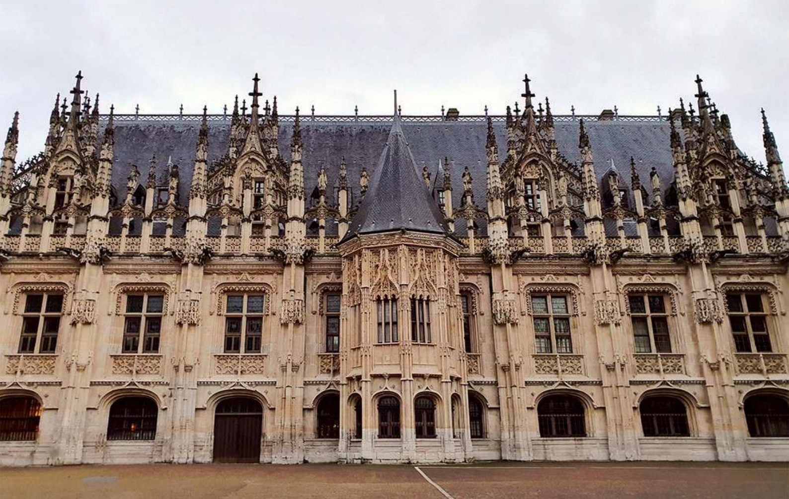
Palais de Justice de Rouen

Un exemple de projet collaboratif mené autour du palais de justice de Rouen qui donne lieu à de nombreuses ressources disponibles sur la plateforme : visite filmée, série d'entretiens menés avec des professionnels de justice et de fiches descriptives dans la base de données Hugo-Patrimoine des lieux de justice