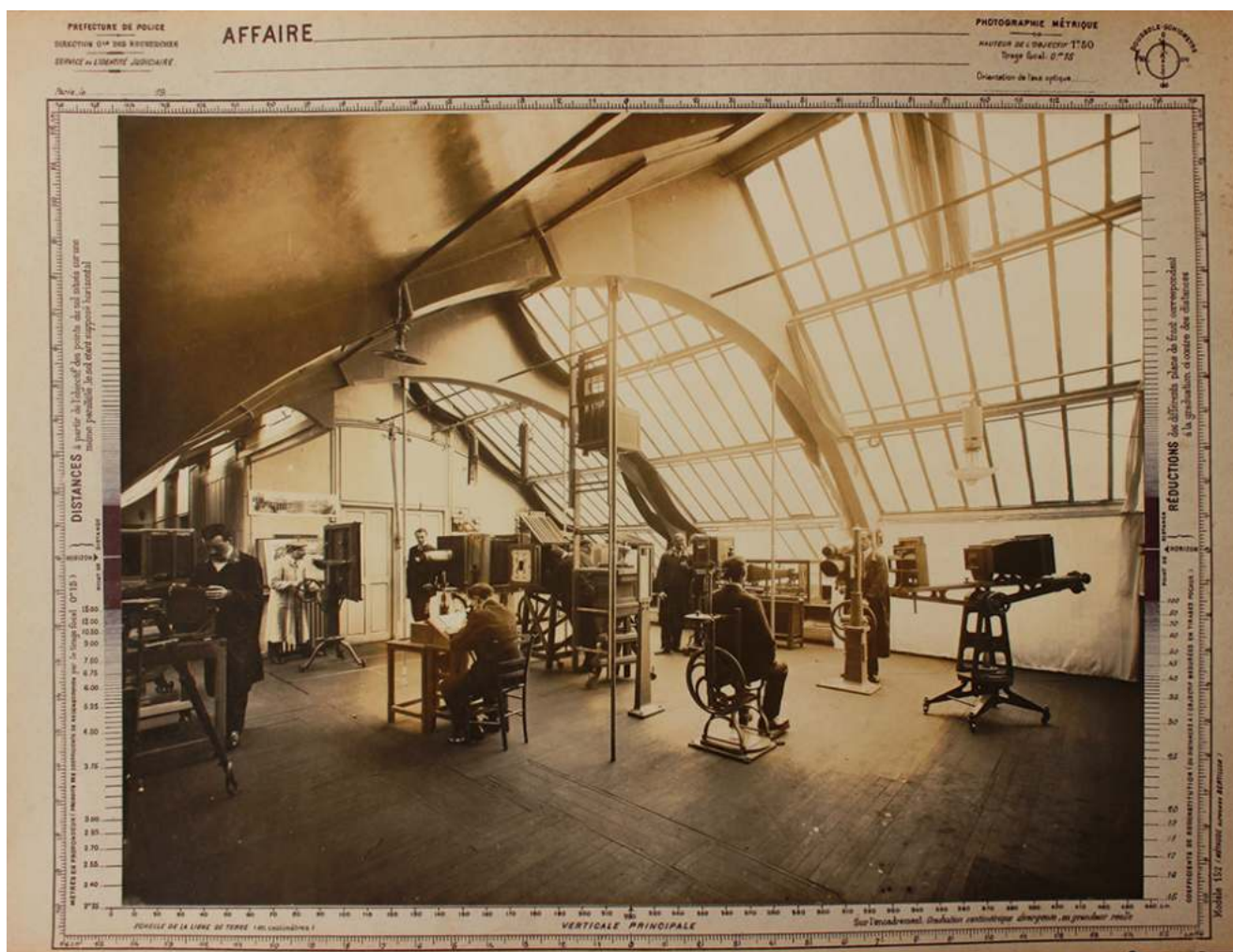
Alphonse Bertillon et l'identification des personnes (1880-1914)