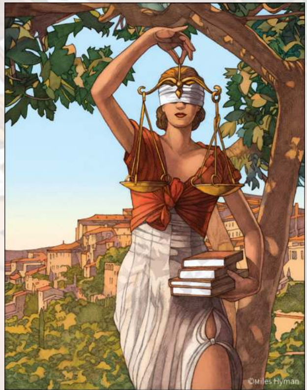
La justice © Miles Hyman

À la création de l'unité, l'équipe du CLAMOR a rencontré le dessinateur Miles Hyman dont elle admirait le travail et le talent. Il a accepté d'illustrer pour Criminocorpus sa représentation de la justice, un sublime dessin qui sert d'emblème à notre musée